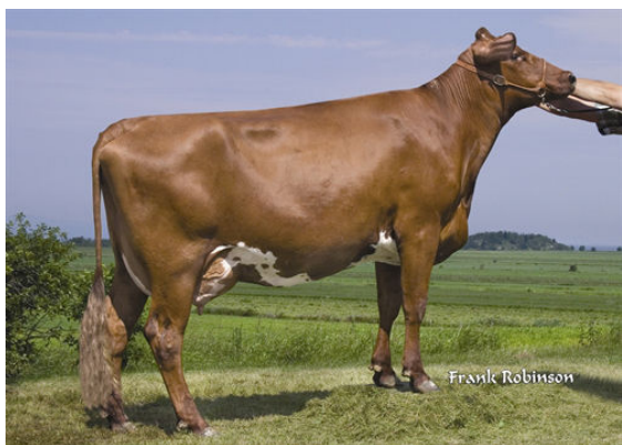
KAMOURASKA PETERSLUND RUBY THIRD DAM