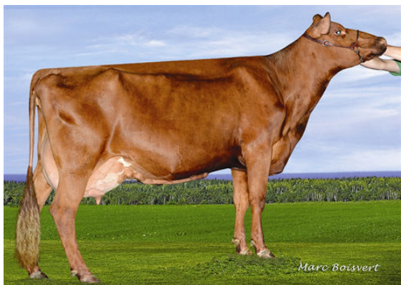
KAMOURASKA ORRA XUBY GRANDDAM